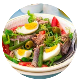
La salade niçoise