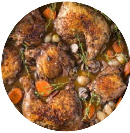
Le coq au vin