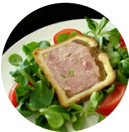
Le pâté en croute