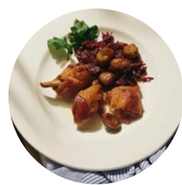
Le confit de canard