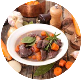
Le boeuf bourguignon