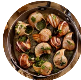
Les escargots (de Bourgogne)