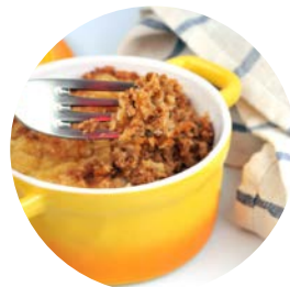
Le hachis parmentier