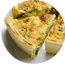
La quiche lorraine