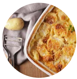
Le gratin dauphinois