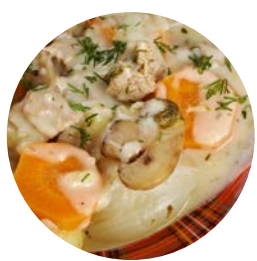
La blanquette de veau