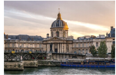
l'Académie française - 23, quai de Conti à Paris

Fais quelques recherches sur cette institution mythique qui défend la langue française depuis sa fondation par Richelieu en 1635.